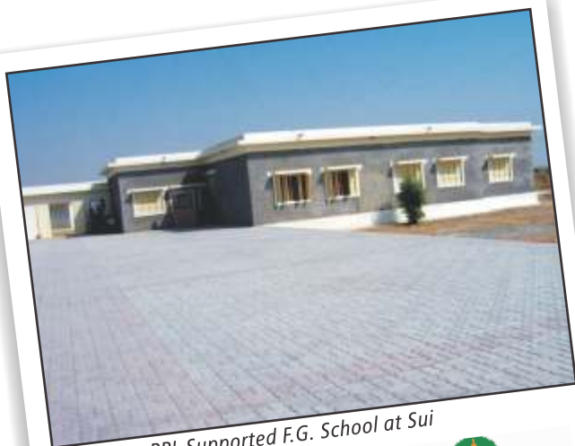
PPL Supported F.G. School at Sui