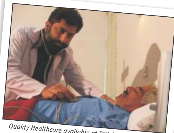
Quality Healthcare available at POL Medical Centre