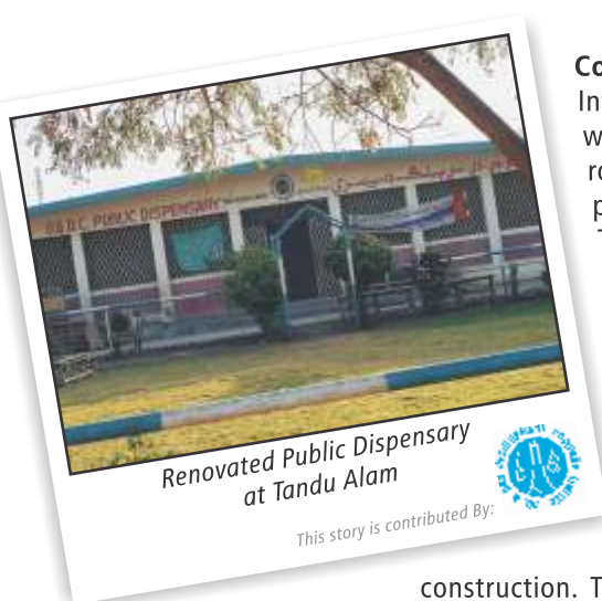
Renovated Public Dispensary at Tandu Alam

POL has implemented over 61 projects to provide better accessibility and transportation. These include improved drainage systems, metalled roads, brick-paved streets, and link roads to make commuting easier. Our extensive water supply schemes have facilitated well boring and provides potable water through POL provided turbine pumps, electric motors, and pipelines. To create a competitive and healthy community, POL has restored sports grounds and regularly presides at various occasions. As a staunch believer in furthering women's education, POL set up a Vocational Training Centre at Khaur to provide training to women of the surrounding areas and equip them with the necessary technical skills to earn a living.