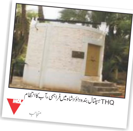
THQ ہسپتال بندہ داؤد شاہ میں فراہمی آب کا انتظام منتخاب

سڑک کی تعمیر و بحال: ہم معیاری اور عمدہ ذرائع آمد و رفت کی اہمیت سے بخوبی واقف ہیں اور اسی بات کی روشنی میں اس امر کو پیش نظر رکھتے ہوئے MOL نے نل بلاک میں اپنے شریک کار (JV. Partner) کے ساتھ مل کر مرحلہ وار طریقے سے پہلے مرحلے میں گرگوری، بندہ داؤد شاہ روڈ کی وسعت اور بحالی کا کام مکمل کر لیا ہے۔ جبکہ دوسرے مرحلے کا کام ابھی جاری ہے۔ تعلیم: MOL پاکستان نے گورنمنٹ گرلز مڈل سکول، شیر کوٹ اور گورنمنٹ کالج، کوہاٹ میں طالب علموں کے لئے درکار مزید کمروں کی تعمیر کا کام سر انجام دیا اور گورنمنٹ گرلز ہائی سکول گوگوری میں لیٹرین اور کمرہ امتحان کی تعمیر کا کام ابھی سر انجام دیا اس کے علاوہ MOL نے ڈسٹرکٹ کرک کے 9 سکولوں کے پرانے فرنیچر کو نئے فرنیچر سے تبدیل کر دیا ہے۔ مستقبل کا لائحہ عمل: ہم MOL پاکستان مقامی افراد کی فلاح و بہبود اور ترقی کے لئے اپنا بھرپور کردار ادا کر رہے ہیں۔ مگر ہمارا خیال ہے کہ ہم مزید ترقیاتی کام بھی کر سکتے ہیں اسی وقت ہم کمیونٹی کی فلاح و بہبود کے لئے ایک طویل المدتی ترقیاتی منصوبہ مرتب کر رہے ہیں۔ جس کے اطلاق سے کمیونٹی کے معاشی و معاشرتی حالات میں مثبت تبدیلی لائی جاسکے گی۔