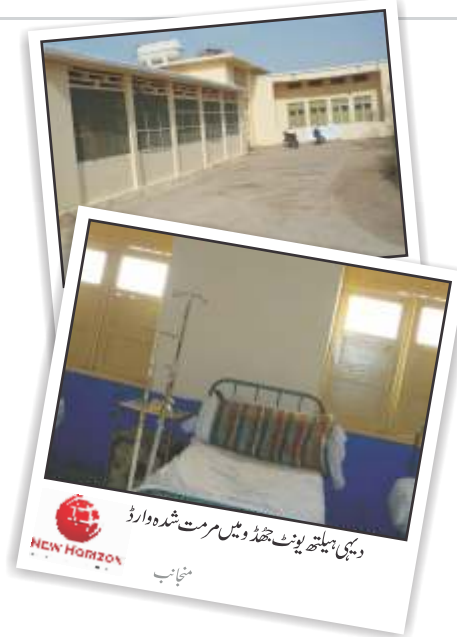
دہلی ہسپتال پونٹ جھڈو میں مرمت شدہ وارڈ منتخاب