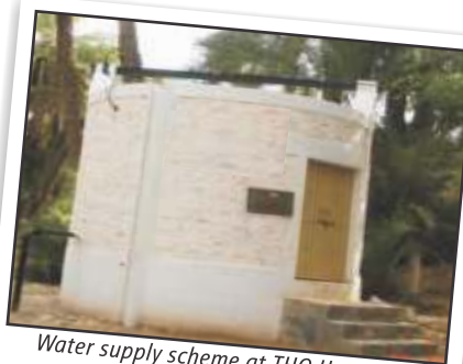
Water supply scheme at THQ Hospital Banda Daud Shah