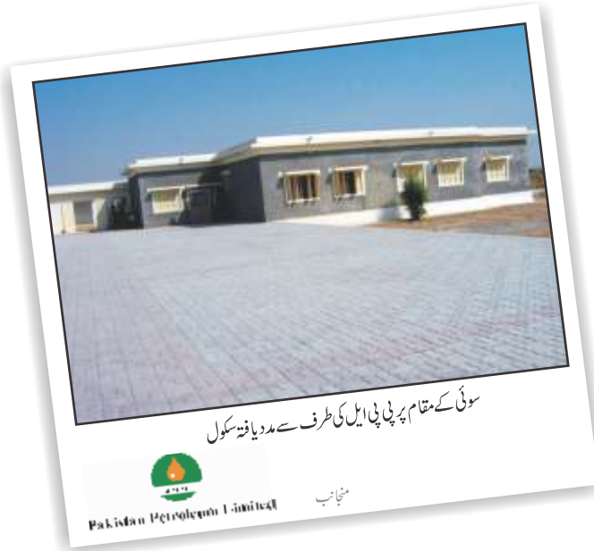
سوئی کے مقام پر پی پی ایل کی طرف سے مدد یافتہ سکول