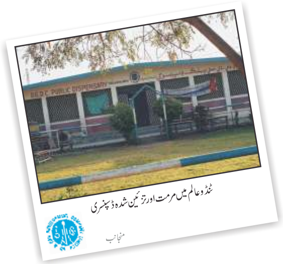
ٹنڈو عالم میں مرمت اور تزئین شدہ ڈسپنسری