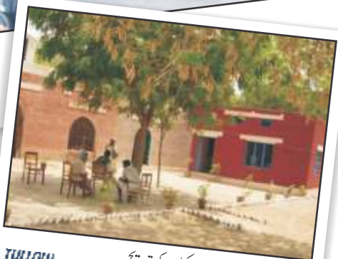
سکولوں کی ترویج