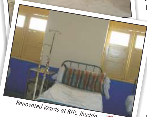
Renovated Wards at RHC Jhuddo